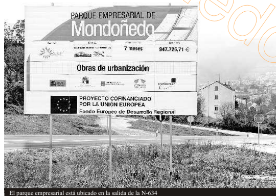
El parque empresarial está ubicado en la salida de la N-634

parque empresarial. El Concello espera que en un plazo no superior a un año todas las parcelas estén cubiertas, ya que en los últimos días se están recibiendo diferentes solicitudes de empresarios que se interesan en el asentamiento en este