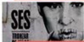
SES 18 outubro - 21.00 h. Praza da Catedral - Entrada de balde