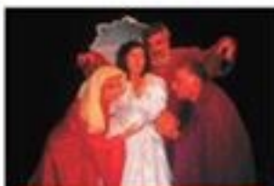
EL SINOR PRESENTA: "XENTE PALIDA DE PEL" 17 outubro - 19.30 h. Casa da Xuventude - Entrada de balde