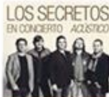
LOS SECRETOS QUINTETO ACÚSTICO 18 outubro - 19.00 h. Auditorio - Entradas: branca con 15€