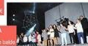
VOCES DA PAULA 19 outubro - 22.00 h. Alameda - Entrada de balde

A comisión de "As san Lucas 2015" agradece a súa colaboración e deséxalles ¡Boas Feiras e Festas!